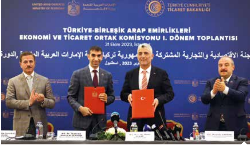
Ticaret Bakanı Ömer Bolat, Türk şirketlerinin BAE'deki yatırımlarının yaklaşık 350 milyon dolar düzeyine ulaştığını belirtti.

Türkiye ile Birleşik Arap Emirlikleri (BAE) arasında ikili ticaret, yatırım, müteahhitlik, gümrük ve üçüncü ülkelerde iş birliği konularında JETCO 1. Dönem Protokolü imzalandı. Ticaret Bakanı Ömer Bolat, iki ülke arasındaki 14 milyar dolar düzeyindeki ticaret hacminin 25 milyar dolara ulaşmasını hedeflediklerini belirtti.