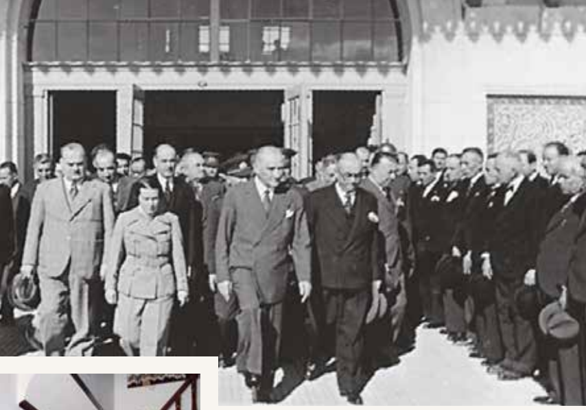
Ulu Önder Mustafa Kemal Atatürk, cumhuriyetin ilanından önce iki kez, Cumhuriyet Dönemi'nde ise yedi kez olmak üzere dokuz kez Adana'ya geldi. Atatürk, 13 Ocak 1925 tarihli ziyaretinde, Adana Belediyesi tarafından verilen hemşehrilik ünvanını kabul etmişti.