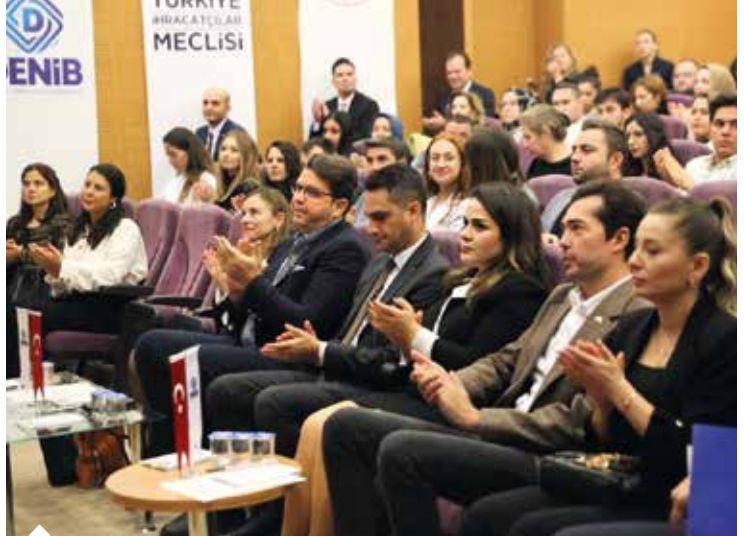
Ticaret Bakanlığı koordinasyonunda, Denizli İhracatçılar Birliği ile TİM E-İhracat Sekreteryası iş birliğinde düzenlenen E-İhracat Eğitim Programı'nda Denizlili ihracatçılara AKİB E-İhracat Projesi tanıtıldı.

Ticaret Bakanlığı'nın sunduğu e-ihracat desteklerinden faydalanmak için gereken önemli noktalardan biri de Türk malı imajının korunmasına yönelik. Buna göre, destek kapsamında gerçekleştirilen faaliyetlerde ya da tanıtımı yapılan markada; Türk ürünü imajına zarar verilmemesi gerekiyor. Ülke menşesini farklı gösteren ifade, sembol, şekil, işaret, ülke ve şehir isimlerinin kullanılması ya da ülke imajına zarar verildiğinin bakanlık yurt dışı temsilcisi (ticaret müşaviri/ataşesi veya bakanlık tarafından görevlendirilen bakanlık temsilcisi) tarafından tespiti durumunda önlem alınıyor. Türk ürünü imajına zarar verildiğinin veya farklı ülke menşesini gösteren ifade kullanıldığının tespiti hâlinde, faaliyete ilişkin giderler, Ticaret Bakanlığı'na bağlı İhracat Genel Müdürlüğü tarafından yapılacak değerlendirme ile destek kapsamından çıkarılıyor, firmaların yaptığı e-ihracatla ilgili ödeme başvuruları değerlendirmeye alınmayarak reddediliyor.